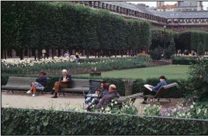
le parisien, la parisienne le provincial, la provinciale