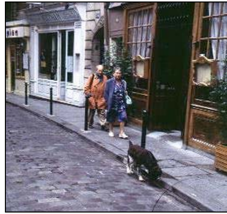
Les Parisiens aiment promener leurs chiens.